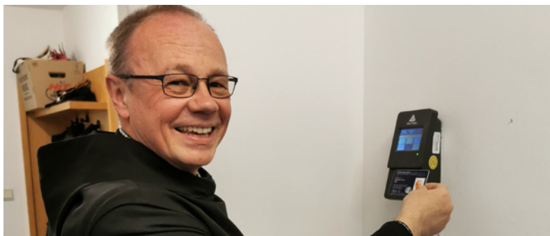
Abb.: AIDA ORGA GmbH

Im Abteiforum mit Gaststätte werden Gerichte aus eigener Produktion angeboten und neben Gästen